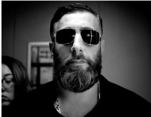
KIDA KHODR RAMADAN