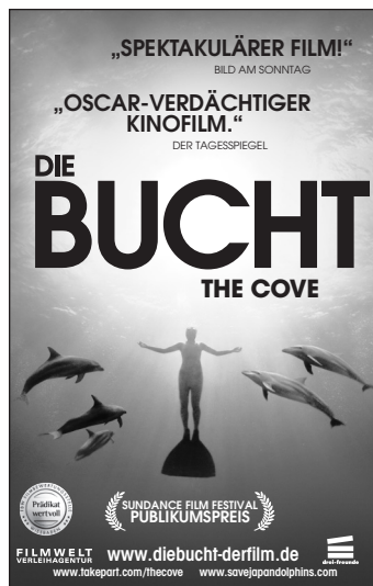
Motiv 7: 45 x 70 mm