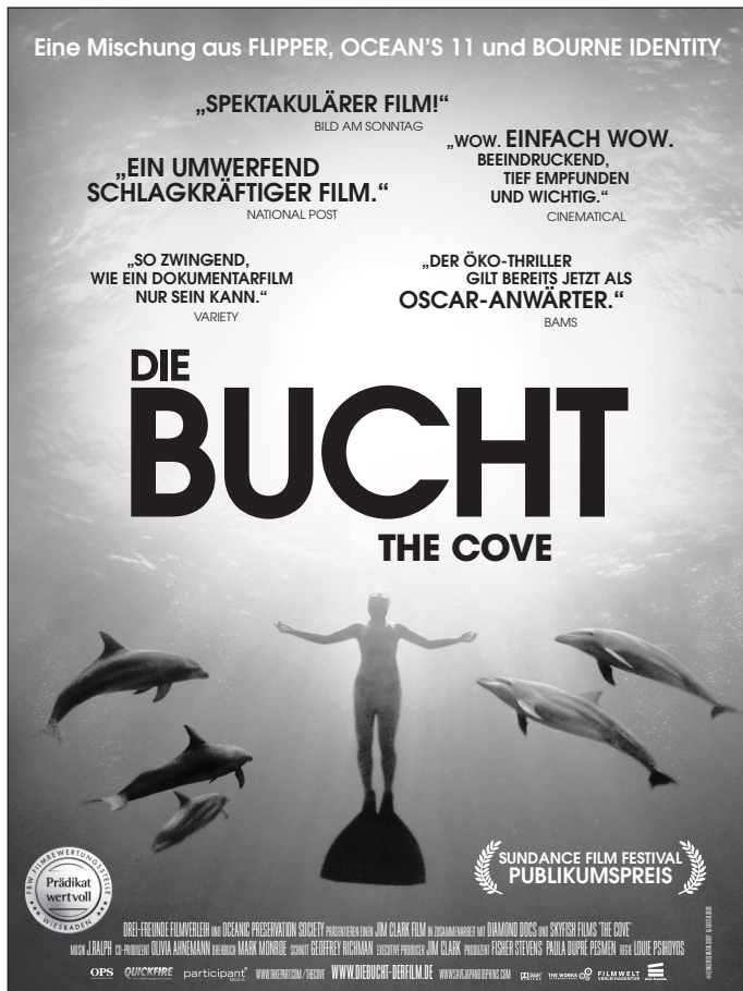
Motiv 1: 90 x 120 mm