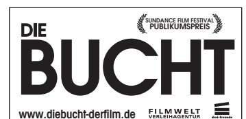
Motiv 9: 45 x 23 mm