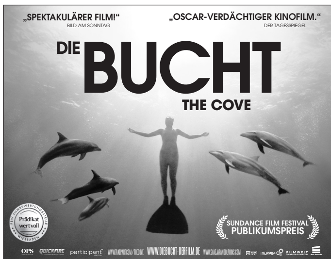
Motiv 2: 90 x 70 mm