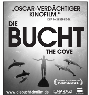
Motiv 6: 45 x 50 mm