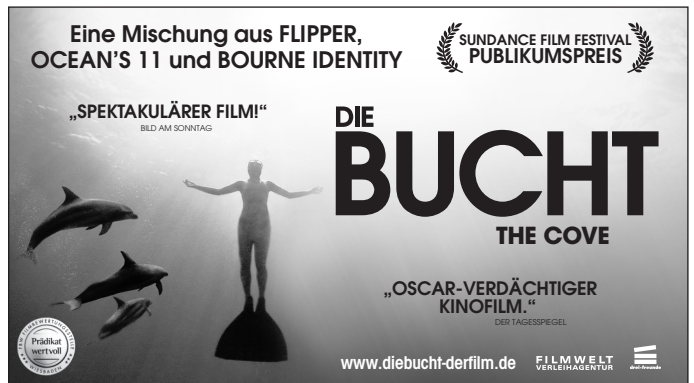
Motiv 4: 90 x 50 mm