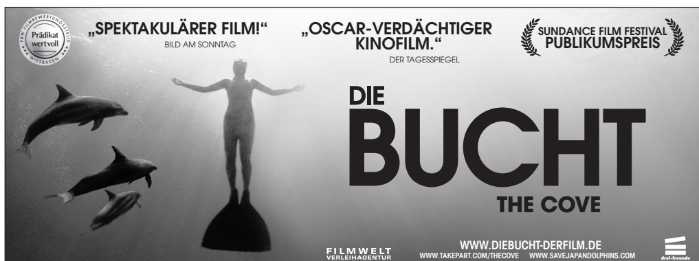
Motiv 3: 135 x 50 mm